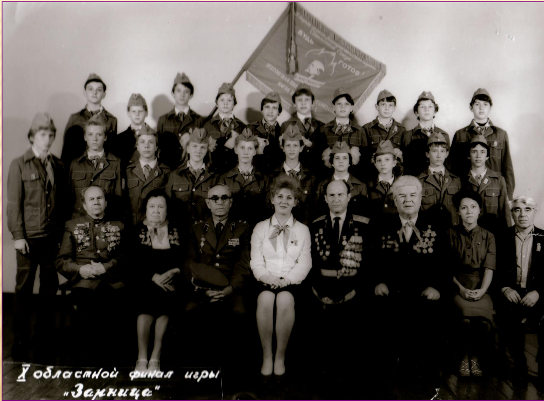
У областной финал игры "Зарница"